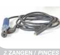
2. ZANGEN / PINCES