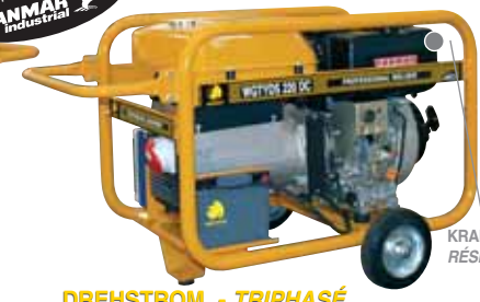
KRAFTSTOFFTANK 16 L. RÉSERVOIR 16 L.