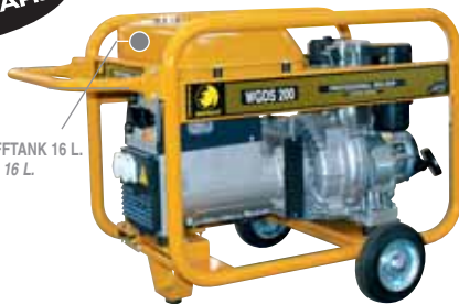
KRAFTSTOFFTANK 16 L. RÉSERVOIR 16 L.