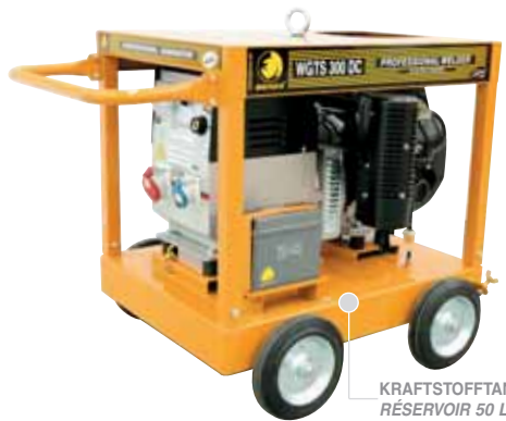
KRAFTSTOFFTANK 50 L. RÉSERVOIR 50 L.