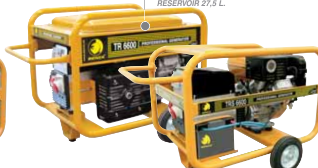
KRAFTSTOFFTANK 27,5 L. RÉSERVOIR 27,5 L.