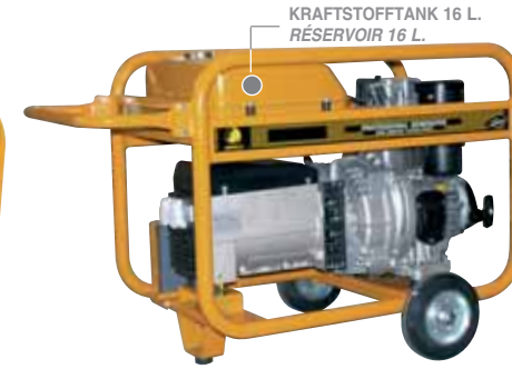
KRAFTSTOFFTANK 16 L. RÉSERVOIR 16 L.