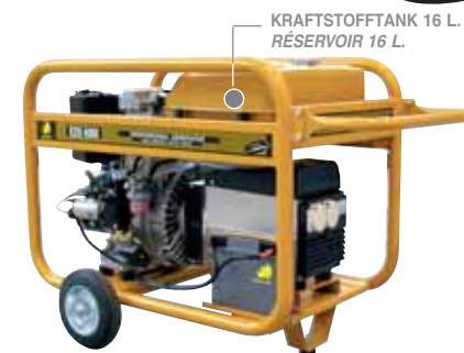
KRAFTSTOFFTANK 16 L. RÉSERVOIR 16 L.