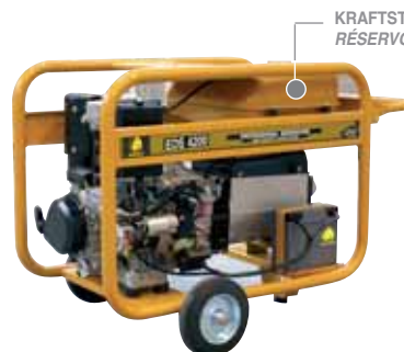
KRAFTSTOFFTANK 16 L. RÉSERVOIR 16 L.