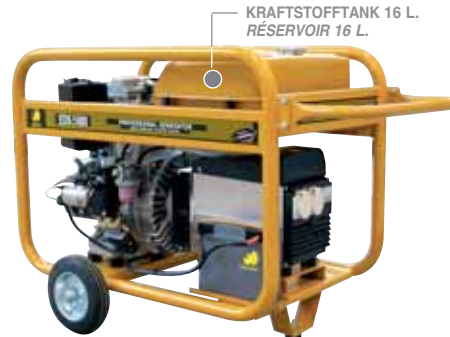
KRAFTSTOFFTANK 16 L. RÉSERVOIR 16 L.