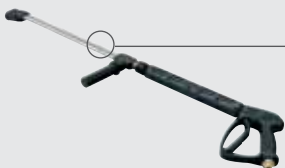
DOPPELLANZE LANCE DOUBLE

Alle Modelle sind mit Subaru oder Yanmar Motor ausgerüstet, besitzen eine Hochleistungspumpe mit Keramikkolben, um den Verschleiß bei Arbeiten mit geringer Drehzahl zu verringern, wodurch eine Steigerung der sicheren und wirkungsvollen Nutzung dieser Reiniger erzielt wird.