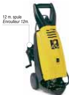
12 m. spule Enrouleur 12m.