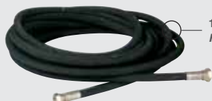
10 M LANGER HOCHDRUCKSCHLAUCH FLEXIBLE HAUTE PRESSION 10 M.